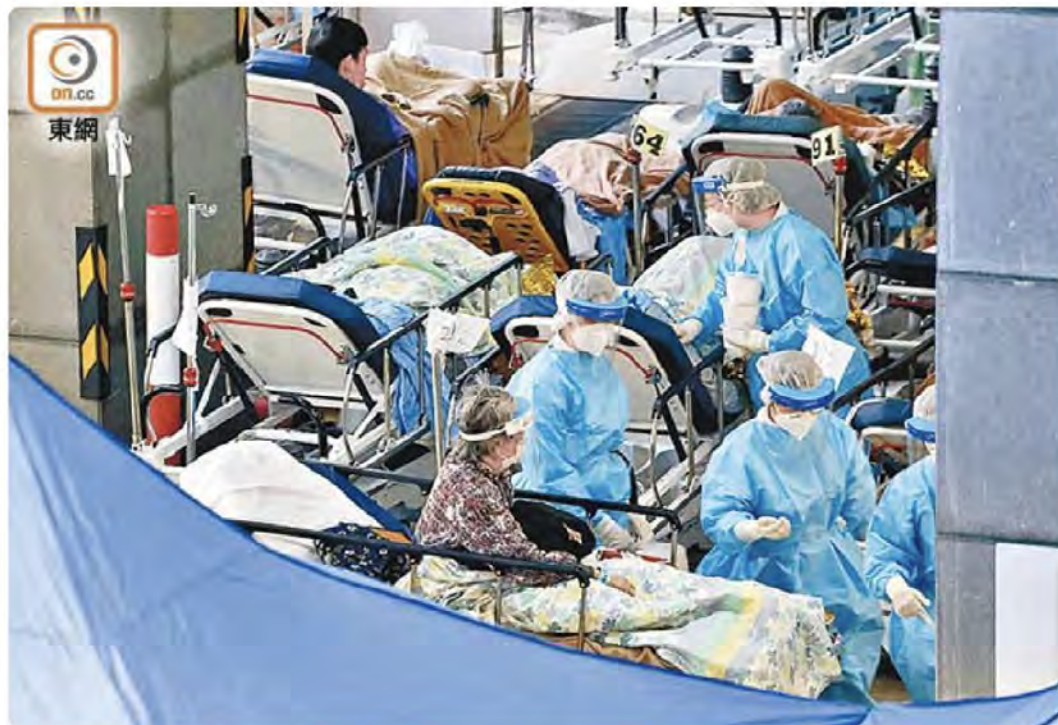
當局盼修改出院準則，加快病床流轉。

【本報訊】疫情大爆發，抗疫最前線率先淪陷，政務司司長李家超及食物及衛生局局長陳肇始昨日在立法會會議上，不約而同強調，疫情爆發已超出特區政府負荷。為加快病床流轉，政府月內第三次放寬出院準則，設立隔離設施及醫院留醫的患者，確診7日後未有驗出病毒，且家居情況許可，即可回家隔離；第14天無驗出病毒便可自由離開。如第7天檢測仍帶病毒，或家居情況不許可，須續在社區隔離設施逗留至第14天，無驗出病毒才可離開；滯留社區的患者，只要等候足14天又無驗出病毒，同樣可自由離開家居。