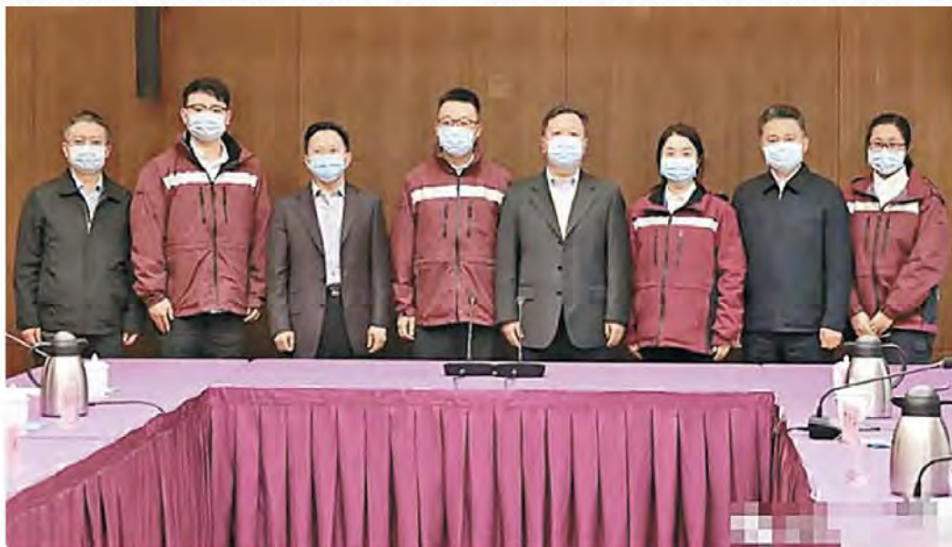
專家組先在深圳舉行發布會。

【本報訊】為支持香港抗擊新冠肺炎疫情，國家衛生健康委副主任、國家疾病預防控制中心局長王賀勝靠前指揮，周四（17日）在深圳召開專家工作組會議，指導廣東省於當日派出第一批內地支援香港抗疫流行病學專家組以及移動核酸檢測車入港。內地4人專家團於昨午約5時，經深圳灣口岸抵達香港，行政長官林鄭月娥及食物及衛生局局長陳肇始等抗疫團隊前往迎接。